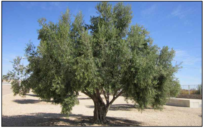
OLIVO (OLEA EUROPEA).