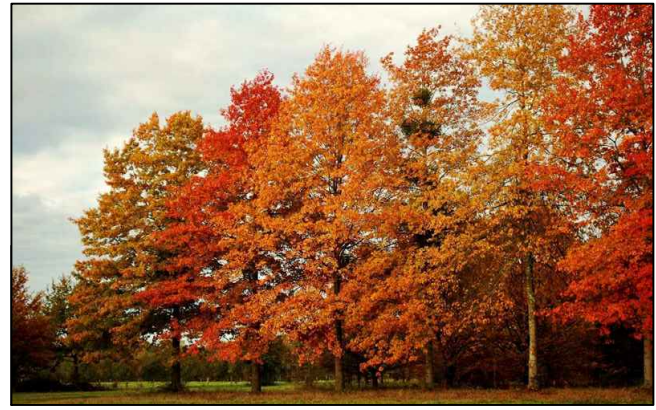
ROBLE ROJO (QUERCUS RUBRA).