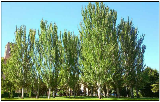
CHOPO BLANCO PIRAMIDAL (POPULUS ALBA VARIEDAD BOLLEANA).