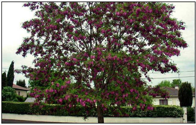
FALSA ACACIA ROSA (ROBINIA PSEUDOACACIA "CASQUE ROUGE").