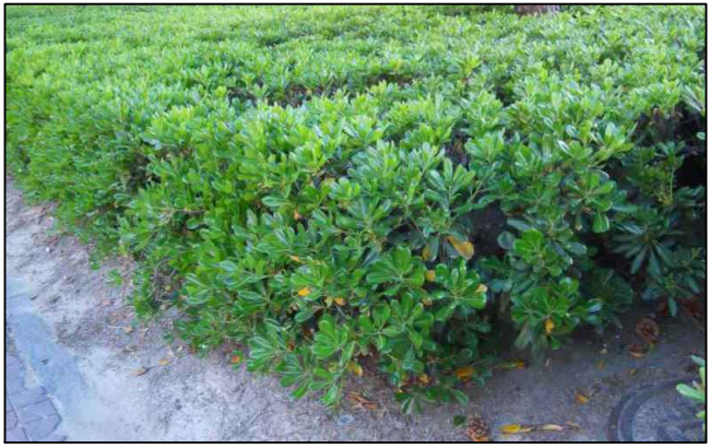
SETO PITOSPORO (PITLOSPOURUM TOBIRA).