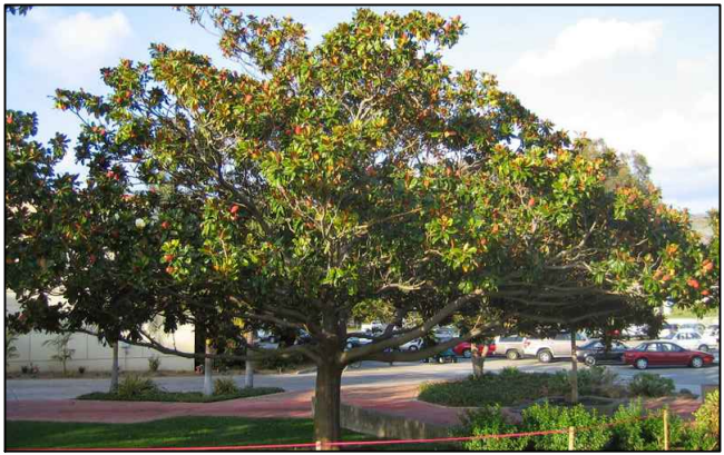
MAGNOLIA (MAGNOLIA GRANDIFLORA).