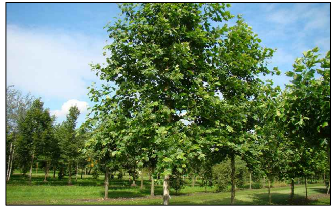
PLATANO DE SOMBRA (PLATANUS ORIENTALIS VARIEDAD ACENIFOLIA).