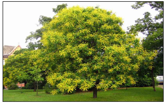
JABONERO DE CHINA (KOELREUTERIA PANICULATA).