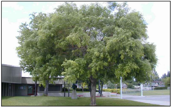
ACACIA DE JAPÓN (SOPHORA JAPONICA).