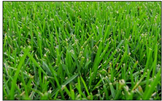
CÉSPED TIPO SAHARA DE ZULUETA.